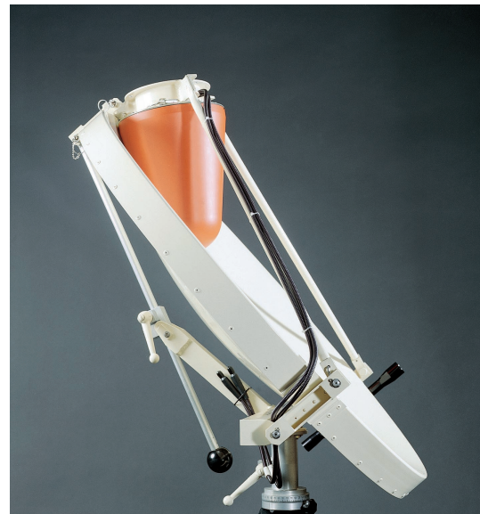
Mikrowellen-Richtantenne AC008 im Transportzustand